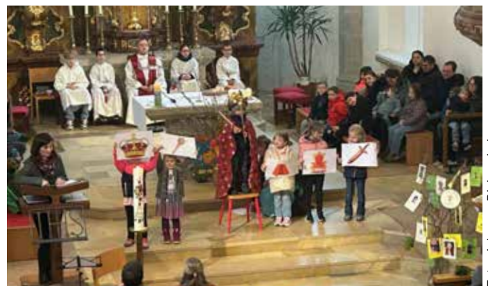
Mit Zeichen zeigen die Kinder: Jesus ist ein König der Liebe und des Friedens