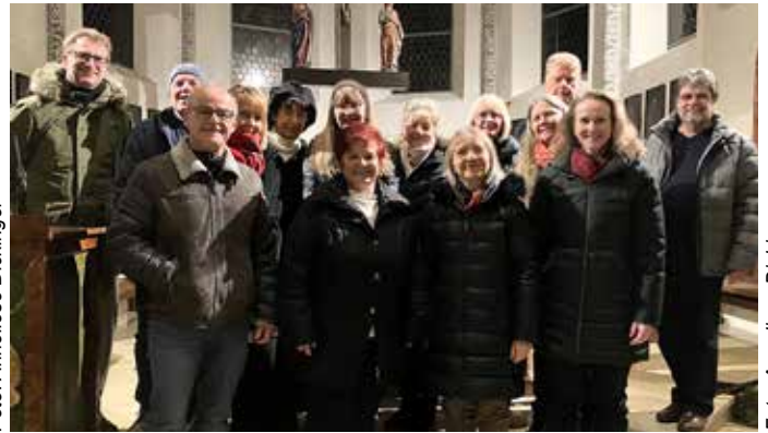
Vielen Dank allen Mitgestaltern des Psalmenklangs 2026

Der „Psalmenklang 2026“ am Samstag 28. März in der Pfarrkirche Fischlham, widmete sich heuer dem Thema LIEBE.