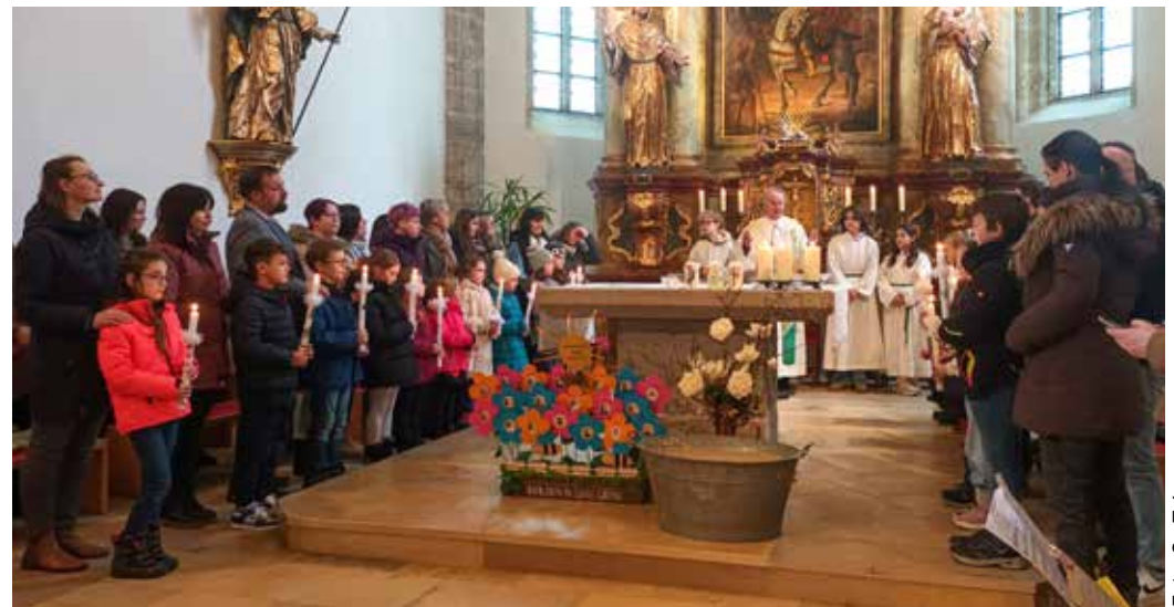
Die Erstkommunionkinder mit ihren Taufpaten bei der Tauferneuerung am 08. Februar

Ein besonders liebevoll gestalteter Moment der Feier war die Lesung „Die kleine Blume“, die von den Kindern in Form eines Spiels lebendig dargestellt wurde. So wurde auf anschauliche Weise sichtbar, wie