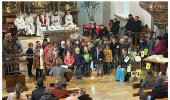
Die Kindergartenkinder zeigen singend, was Jesus als König ausmacht.