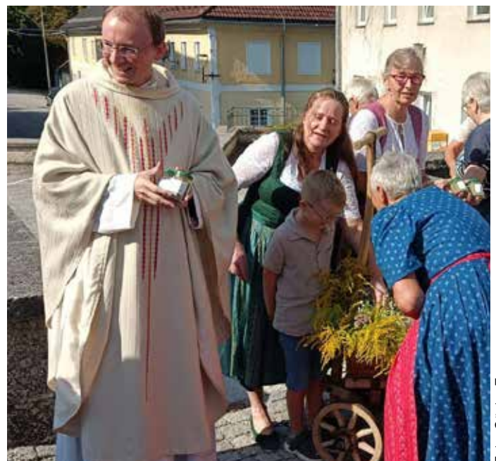
Das selbstgemachte Kräutersalz erfreut sich jedes Jahr großer Beliebtheit