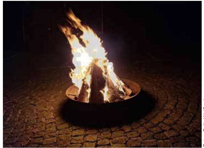
Das Osterfeuer als Treffpunkt für die Osterfestgemeinschaft