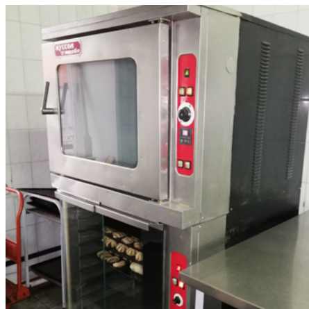
Heizstäbe und Gummidichtungen wurden schon ausgetauscht, dennoch ist der Ofen in der Caritasküche nicht mehr voll einsatzfähig.