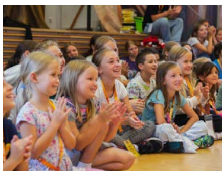
Seite 4: Kisi-Kids