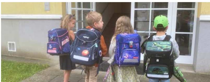
Auf dem Weg zur Schule