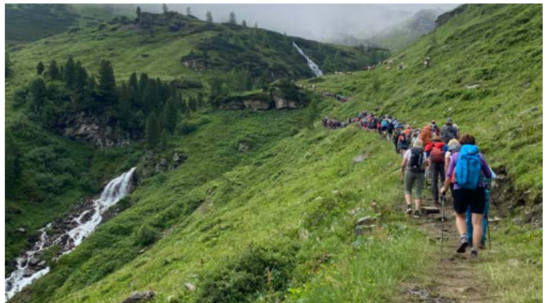
Auf dem Pilgerweg