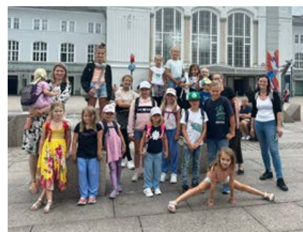
Seite 5: Aus der Pfarrgemeinde