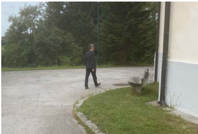
Am Weg zur Kirche