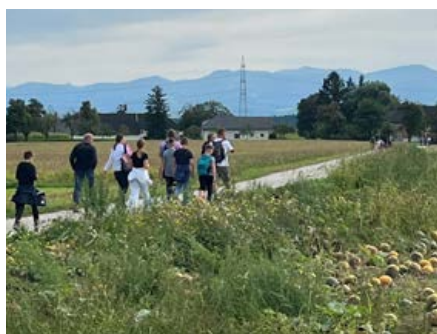
Seite 3: Mit auf dem Weg