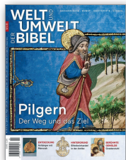
Welt und Umwelt der Bibel, Pilgern. Der Weg und das Ziel, Stuttgart (Kath. Bibelwerk e.V.) 2026, 80 Seiten, € 13,40

Diese Ausgabe von „Welt und Umwelt der Bibel“ erkundet Pilgern als religionsgeschichtliches, psychologisches und gesellschaftliches Phänomen. Sie führt zu den Wallfahrtsorten des Alten und Neuen Testaments, blickt auf jüdische, christliche, pagane und islamische Traditionen und fragt nach Ritualen, Wegen, Infrastrukturen und wirtschaftlichen Interessen. Eine Ausgabe über Aufbruch, Sehnsucht und die vielen Wege zum Heiligen.