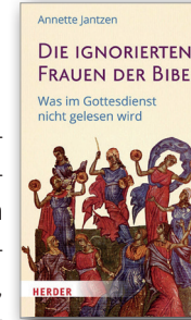
Annette Jantzen, Die ignorierten Frauen in der Bibel. Was im Gottesdienst nicht gelesen wird, Freiburg i. Br. (Herder Verlag) 2026, 304 Seiten, € 24,70

Die kirchliche Leseordnung prägt maßgeblich, welche biblischen Erzählungen wahrgenommen werden, und die Auswahl fällt ganz eindeutig zu Ungunsten der Frauen aus. Nur rund ein Drittel der biblischen Frauengestalten kommt in den gottesdienstlichen Lesungen vor und deren Geschichten werden in aller Regel stark gekürzt. Sie gibt mit diesem Buch den ignorierten Frauen der Bibel ihre Geschichte zurück und den Lesenden damit ein breiteres Spektrum an weiblichen Identifikationsfiguren.