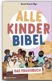
Sarah Vecera (Hg.), Alle-Kinder-Bibel. Das Praxisbuch , Neukirchen-Vluyn (Neukirchener Verlag) 2026, 176 Seiten, € 20,60

Wie kann man die vielfaltssensibel erzählten und gezeichneten Geschichten in KiTa, Kinderkirche und Schule einsetzen und gemeinsam mit Vor- und Grundschulkindern erkunden? Dieses Praxisbuch hilft weiter: Mit flexibel einsetzbaren Bausteinen, religionspädagogisch fundierten Ansätzen und kreativen Ideen! Dabei werden auch die eigenen Kompetenzen im Bereich von Vielfalts-sensibilität und deren Vermittlung gestärkt. Enthalten sind Einleitungen und Lesehilfen für die Alle-Kinder-Bibel-Geschichten, die den Blick verändern und Unentdecktes aufzeigen; sowie Bausteine für Unterricht, Gruppenstunden und Kindergottesdienste, die ohne viel Vorbereitung direkt umgesetzt werden können.