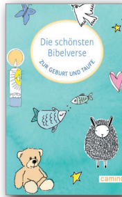
Die schönsten Bibelverse zur Geburt und Taufe, Stuttgart (camino Verlag) 2026, 112 Seiten, € 15,50

Die Geburt eines Kindes und seine Taufe sind bewegende Momente voller Freude, Dankbarkeit und Liebe. Dieses Buch vereint die schönsten Bibelverse zur Geburt und zum Tauffest – eine einzigartige Zusammenstellung inspirierender und segnender Worte aus der Einheitsübersetzung. Es spricht von Gottes Nähe, von Vertrauen, Schutz, Segen und seiner unendlichen Liebe, die jedem Kind auf seinem Lebensweg mitgegeben wird. Das Buch enthält auch eine Auswahl der schönsten Vorschläge für Taufsprüche – eine wertvolle Hilfe für Eltern, Pat:innen und alle, die auf der Suche nach einem bedeutungsvollen Vers für diesen besonderen Anlass sind.