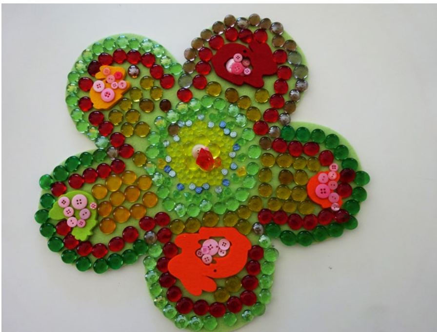
Die Mandalas werden gemeinsam oder alleine gelegt. Jedes einzelne davon ist besonders.

Ostern ist ein symbolischer Beginn für den Frühling. Im Frühling erwacht das Leben wieder neu. Dies sollen die Kinder durch bewusste Sinneserfahrung und Naturerlebnisse erleben. Die Vorfreude auf dieses schöne Fest steigt. ■