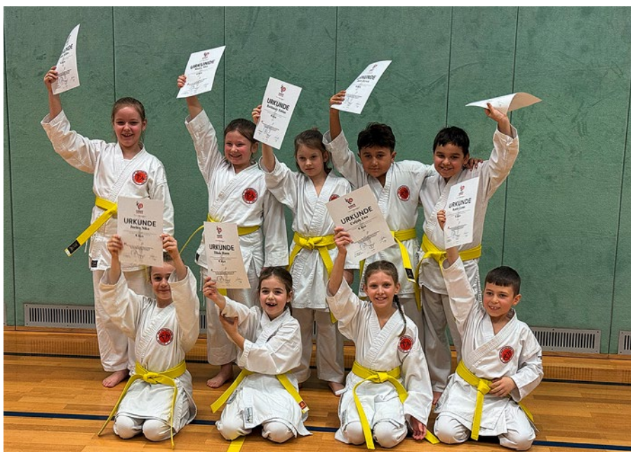
Die Teilnehmer:innen des Anfängerkurses und der Oberstufe haben ihre Gürtelprüfung erfolgreich bestanden. Auch Auszeichnungen wurden verliehen.

der Landesmeisterschaft in Freistadt anzutreten und sind motiviert, auch dort zu überzeugen! ■