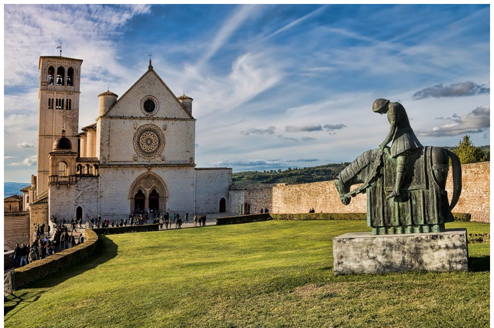
Das Denkmal des heiligen Franziskus am Pferd vor der Oberkirche San Francesco in Assisi (Italien)