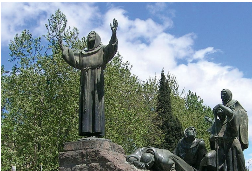
Franziskus Denkmal vor der Lateranbasilika in Rom

◀◀ Auf der Titelseite ist die beeindruckende, als Doppelkirche gebaute Basilika San Francesco in Assisi (Italien) zu sehen.