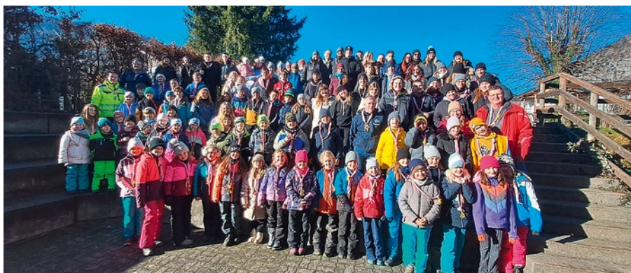
Mehr als 130 Pfadfinder:innen nahmen am Winterlager 2025 teil.

Nach dem Mittagessen traten wir mit vielen Erinnerungen die Heimreise in ein leider wittertechnisch graues Traun an. Ein großer Dank an alle, die mitgeholfen haben, dass unser Winterlager wieder so erfolgreich war. ■