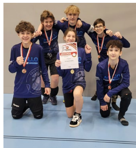
Die männliche U14 ist Faustball-Bezirksmeister.

Sektion Faustball: U14 männlich ist Bezirksmeister! Die Jugendmannschaft der SPG Traun-St. Martin hat sich am Heimspieltag belohnt und sich zum Meister gekrönt. Mit starker Teamleistung konnte man gegen die Teams aus Urfahr und Froschberg jeweils 3:0 gewinnen und somit die Höchstpunktzahl einheimsen. Nachdem bereits die erste Runde erfolgreich war, konnten sich die Trauner ungeschlagen den ersten Platz und damit den Meistertitel sichern. Damit sind sie berechtigt, bei