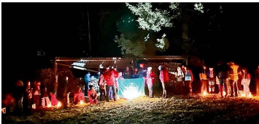
Die Waldweihnachtsfeier war das Highlight des Pfadfinderwinterlagers in St. Gilgen am Wolfgangsee.

der Teilnehmer:innen mit den Wichteln & Wölflingen (WiWö), den Guides und Spähern (GuSp), Gruppenleitung, Elternrat und der Junggilde mit ihren Familien. Die Gilde bezog in Fuschl ihr Quartier.