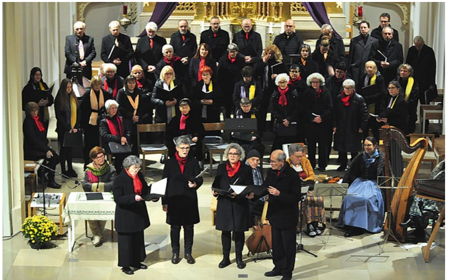
Erstmals wirkten beim Adventsingen drei Chöre mit.