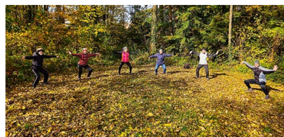
Mitglieder der Sektion »Tai Chi« beim Training