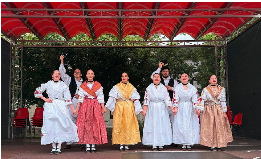
Die Jugendtanzgruppe KUD Tkanica in ihrer Tracht bei »Traun is(s)t bunt«.

Ein wichtiger Treffpunkt für Kultur, Tradition und Zusammenhalt ist der kroatisch-österreichische Kulturverein Tkanica, auch bekannt als »KUD Tkanica«.