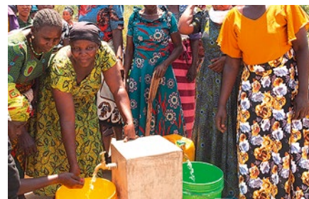
Wasserentnahmestelle von einem solarbetriebenen Brunnen

Dem Wassermangel begegnen die Projektpartner von »Sei So Frei« mit zwei Lösungen: mit Regenwassertanks, die Niederschläge über Dachflächen von Gemeinschaftszentren oder Schulen auffangen; und mit solarbetriebenen Tiefbohrbrunnen, die sauberes Grundwasser aus bis zu 90 Metern Tiefe in einen erhöhten Tank pumpen. Von dort fließt das Wasser mittels Schwerkraft sternförmig zu mehreren Entnahmestellen – so nah wie möglich zu den Menschen in den verstreuten Siedlungen. Diese bilden Wasserkomitees und werden geschult, um den Betrieb und die Wartung übernehmen zu können.