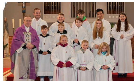
Ministrant:innenaufnahme in St. Martin

Wenn auch du Ministrant:in werden willst, bist du jederzeit herzlich willkommen. Melde dich einfach im Pfarrhof (Tel.: 7 33 96). Franz Asen ■