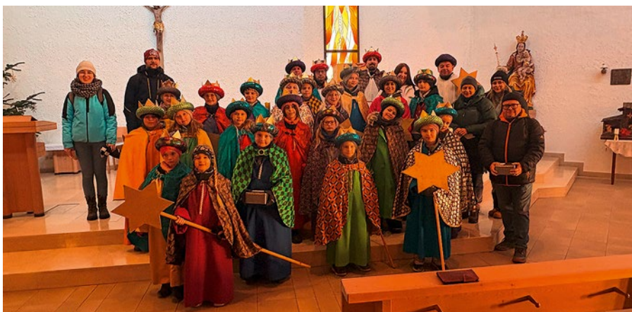
Sternsingergruppe aus Oedt

Danke an alle Begleitpersonen, welche darauf achteten, dass sich niemand verlieh, und die Sternsinger:innen motivierten, immerweiterzusingen, bis auch die letzte Straße begangen war.