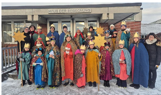
Sternsingergruppe aus St. Martin