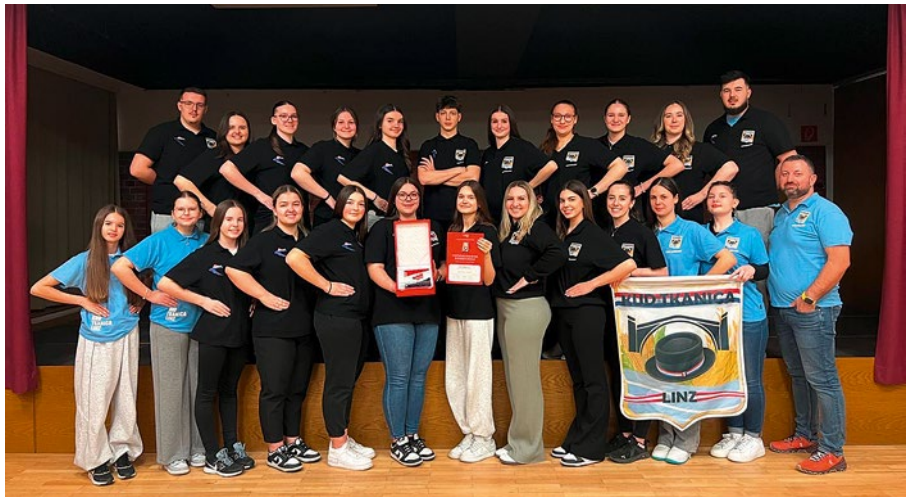
Im Jahr 2025 wurde der kroatische Kulturverein KUD Tkanica für die Förderung der kroatischen Kultur, Tradition und Gemeinschaft außerhalb Kroatiens ausgezeichnet.

In Traun gibt es eine gut organisierte und stark miteinander verbundene kroatische Gemeinschaft. Die Kontakte zwischen den früheren Gastarbeiter:innen und den später nach Traun gekommenen Kroat:innen sind bis heute hervorragend. Diejenigen, die schon länger in Traun leben, unterstützen Neuankommlinge dabei, Arbeit zu finden, die Sprache zu lernen und sich gut in die Gesellschaft zu integrieren.