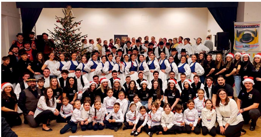
Beim kroatischen Weihnachtsabend im Pfarrheim Oedt waren auch Gastvereine aus Mainz (Deutschland) und Pleternica (Kroatien) zu Gast.

2025 wurde dem Verein KUD Tkanica der renommierte Preis »Večernjakova domovnica« von der kroatischen Zeitung Večernji list verliehen. Er zählt zu den bedeutendsten Ehrungen für Kroat:innen im Ausland und würdigt Vereine und Persönlichkeiten, die sich in besonderer Weise für die Bewahrung und Förderung der kroatischen Kultur,