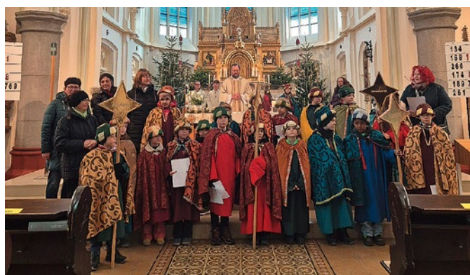
Sternsingergruppe aus Traun

Gesamtergebnis (ohne Erlagscheine): 20.009,40 Euro ■