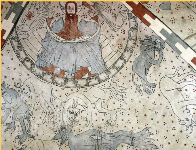
Fresko: Der Schöpfer des Sternenhimmels, Kirche Vittskövle, Skåne