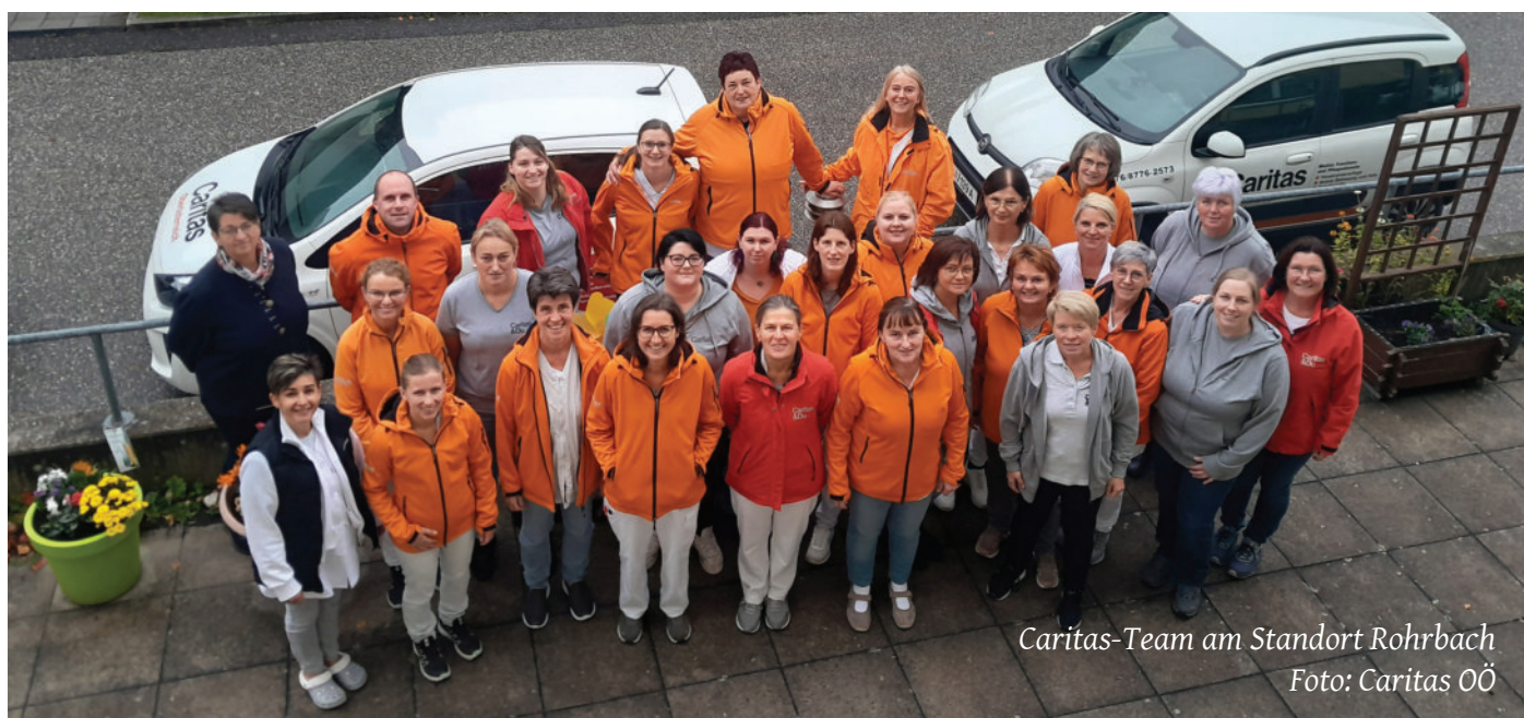
Caritas-Team am Standort Rohrbach