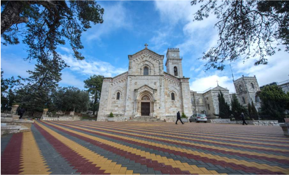
Foto: Emmauskirche in Quebeibeh