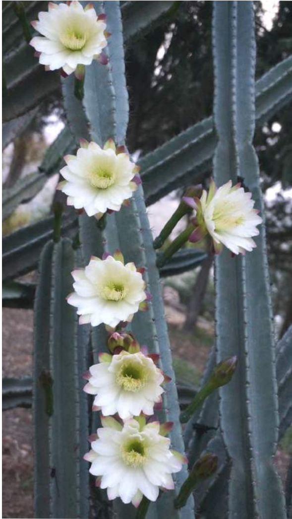
Foto: Königin der Nacht im Emmausgarten