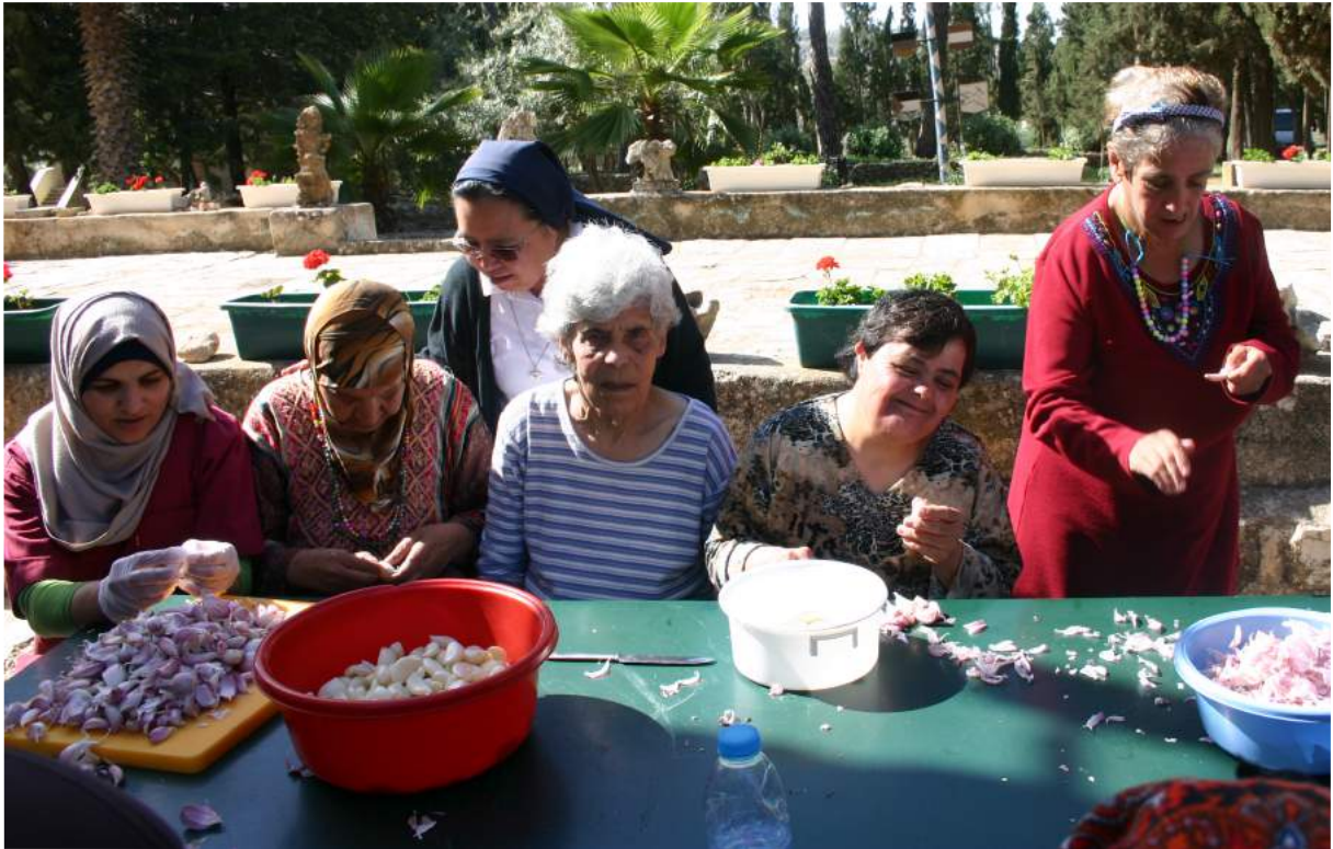
Foto: Bewohnerinnen helfen beim Knoblauchschälen