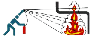
3. Tropf- und Fließbrände von oben nach unten löschen