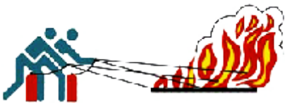
4. Genügend Löscher auf einmal einsetzen - nicht nacheinander