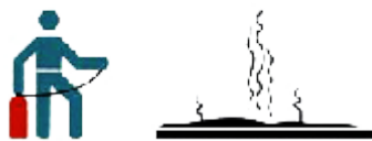
5. Vorsicht vor Wiederentzündung