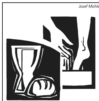
Aus: image 21/2601

Tag der Grabesruhe Jesu. Wir laden ein zum Besuch des Hl. Grabes und zum stillen Gebet. Der Karsamstag ist ein Tag der Stille. Vielleicht kann man auch mit Kindern einen Besuch beim Hl. Grab machen. .