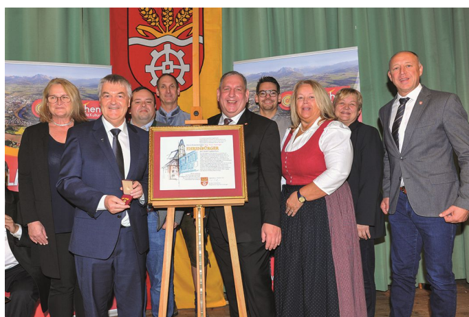
Der Stadtrat Laakirchen gratuliert