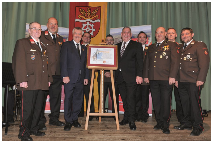
Die FF Laakirchen gratuliert

Der Festakt fand nach dem Erntedankgottesdienst im großen Pfarrsaal statt. Mehr als 200 Gäste waren gekommen.