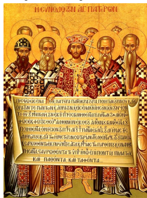
Kaiser Konstantin mit Bischöfen

Wir stehen auf den Schultern von Großen, die für uns gedacht haben, aber von uns neu gelesen und ausgelegt werden können. Wir sind hier mit der Auslegung noch lange nicht fertig.