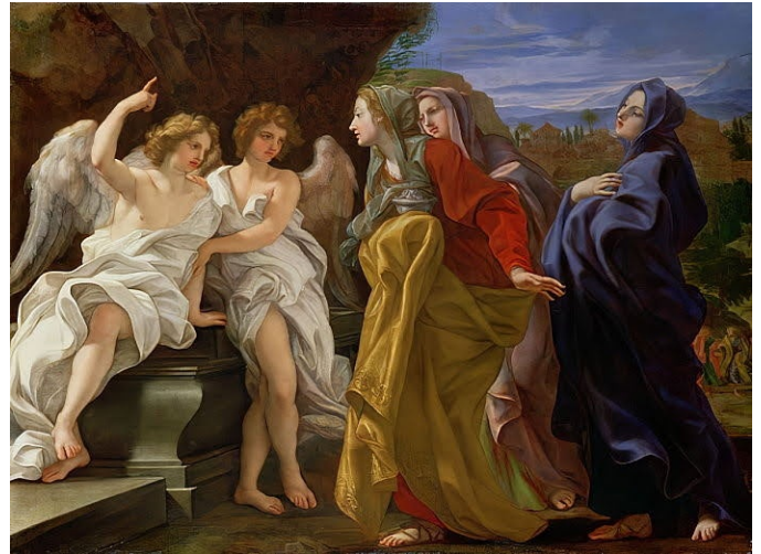
Il Baciccio, Die drei Marien vor dem leeren Grab, 1684-1685.

hingerichtete Jesus von Nazaret lebt, gegen alle Erfahrung und gegen jede Hoffnung – das ist gerade für Lukas nicht „nur“ eine außergewöhnliche, teilweise übersinnliche Begegnung mit dem Auferweckten. Die zunächst reflektierende und dann auch glaubende Mitwirkung der JüngerInnen (und der späteren LeserInnen/HörerInnen des Evangeliums) gehört unabdingbar zum Verstehensprozess dazu. Das macht Lukas immer wieder klar: Ohne Erinnerung an die Verkündigung Jesu, ohne Studium und Interpretation der Schrift (Tora) und der Propheten, ohne gemeinsam geteilte Hoffnungen und Erwartungen, Sehnsüchte und Ängste, sowohl mit dem Volk Israel, wie mit der ganzen Menschheit, bleibt die Auferweckung Jesu unkenntlich, unglaublich (vgl. Lk 24,25-27.32; 24,44-48). Seltsam, die Hoffnungen und Ängste können wir zusammentragen, die Formen der Besserwisserei und die imperialen Machtallüren zertrennen und ersticken uns.