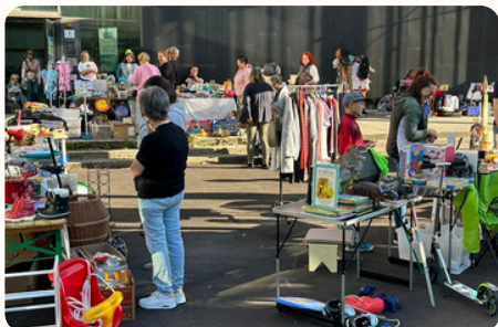
Flohmarkt nach dem Motto „Wir haben den Platz, ihr belebt die Tische“.