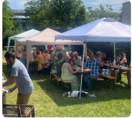
Feste und Veranstaltungen z. B. Fasching, Erntedank, Punschstand, Pfarrfest im Sommer.