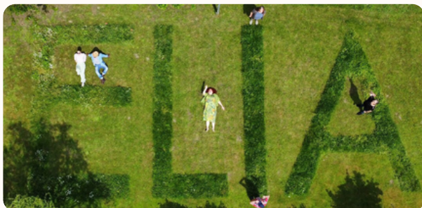
Gemeinschaftsgarten Eine Wohlfühl- und Begegnungs- oase der Begegnung.