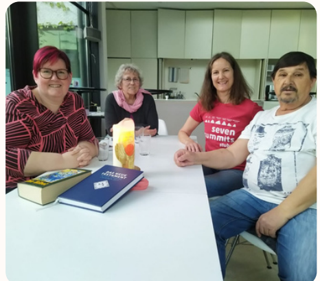
Bibelrunde Über das Wort Gottes reden, Fragen stellen, Wissen erweitern, mit netten Menschen ins Gespräch kommen.