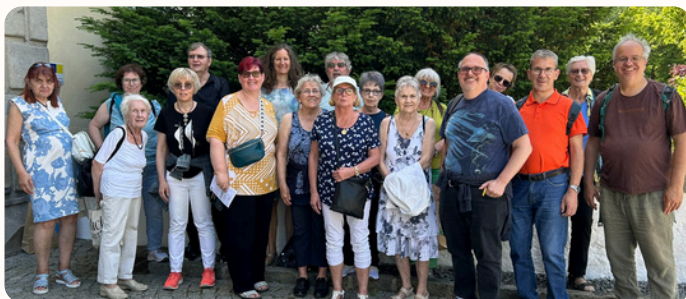
Pfarrausflug: Gemeinsam unterwegs zu vielfältigen Orten.