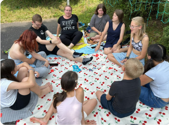
Katholische Jungschar & Jugend Gemeinsam umgesetzt mit der Pfarrgemeinde Pichling.