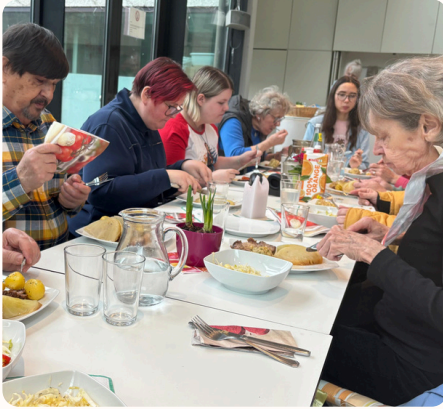
Sonntagsgottesdienste immer mit Pfarrkaffee .

Im Elia gibt es dank unermüdlischen Mitdenkens und -wirkens eine lebendige Gemeinschaft mit einem Schwerpunkt im caritativ gemeinschaftlichen Engagement: