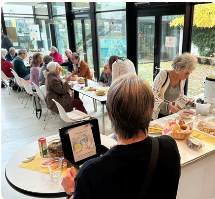
Montagsfrühstück Plaudern, einander Zuhören, sich gegenseitig unterstützen.