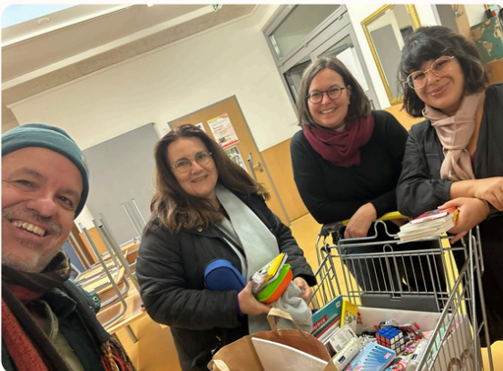
Soziale Aktionen z. B. Familienfasttag, Mitwirkung beim umge- kehrten Adventkalender; Sozialberatung in Ko- operation mit der Regio- nalarcaritas; Unterstützung von Menschen in schwie- rigen Lebenssituationen.