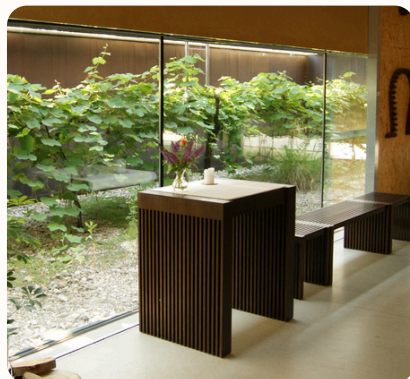
„lebendiges Altarbild“ aus Weinstöcken