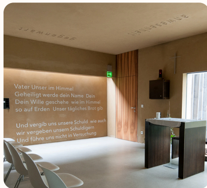
Worte von I. Kumpfmüller und Vater unser in Wand und Decke eingedrückt

Ein gewachsenes Altarbild aus Weinstöcken windet sich um ein Kreuz und über gespannte Drähte – ein Bild für Leben, Verbundenheit und Verwurzelung im Glauben, das sich im Wandel der Jahreszeiten ändert und uns so in den Lauf von Werden und Vergehen mitnimmt.