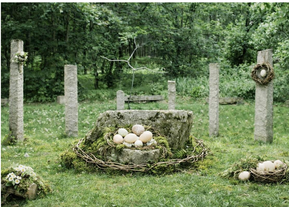
15. Kreuzwegstation in Steyregg (Günther Schuster)

Möge das tiefe Vertrauen, dass das Leben stärker ist als der Tod, Ihnen Kraft schenken – heute und an jedem neuen Tag!