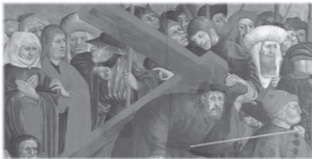
Die Kreuztragung Christi Hans Multscher - 1437 Wurzacher Altar