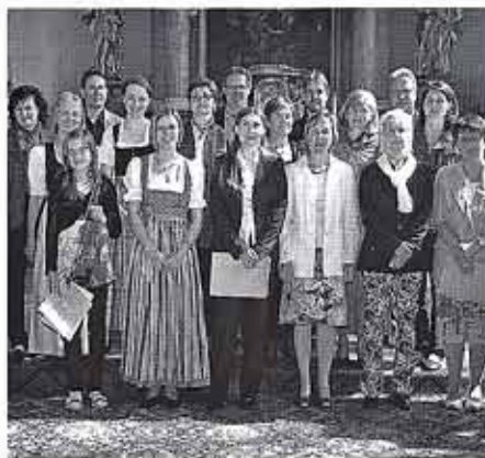
St. Anna Chor