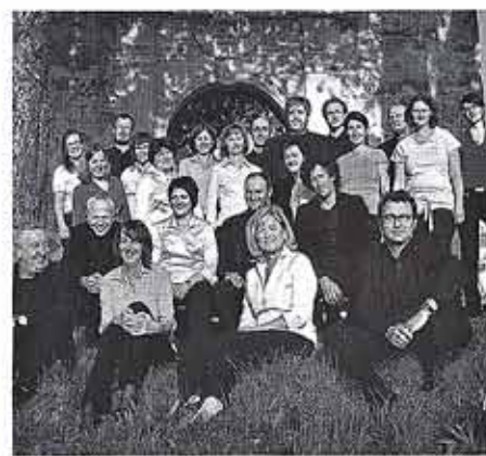
Kalvarienberg Singfoniker in f