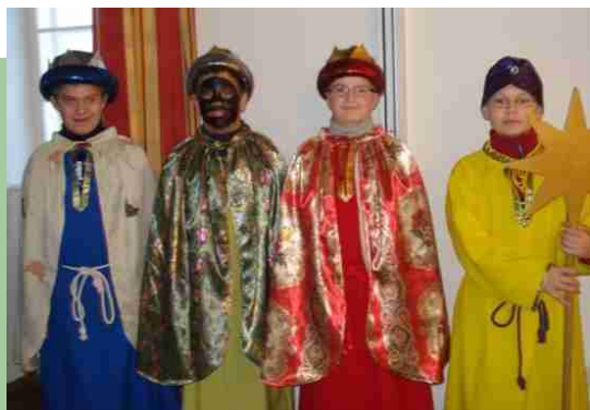
...unsere "kleinen" ...