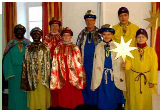
...und "großen" Sternsinger

"Also, ich war natürlich als Kind auch schon Sternsingen, aber jetzt als Erwachsener das war eine sehr schöne Sache. Aufgrund dass wir die Lieder mehrstimmig gesungen haben, hatte man das Gefühl, dass wir bei den Leuten sehr gut angekommen sind. Da wir zeitmässig noch keine Erfahrung hatten gingen wir das Ganze ein wenig zu schnell an und schlugen so manche Einladung zu Kaffee und oder zu ..., aus.