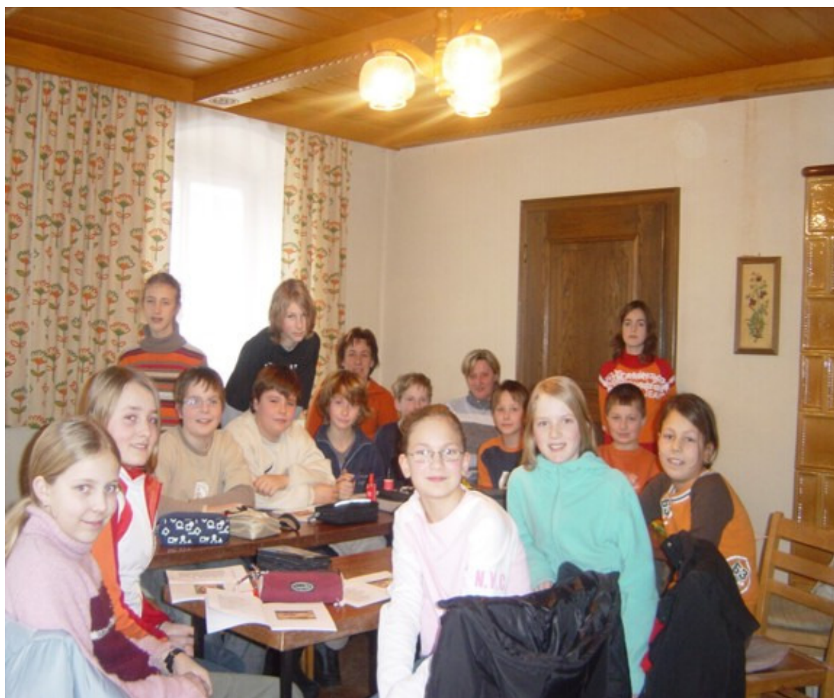
Erste Firmstunde im Pfarrhof

Ein herzliches Dankeschön an Waltraud Dieplinger und Margarete Dornetshumer für die Betreuung unserer Firmlinge.