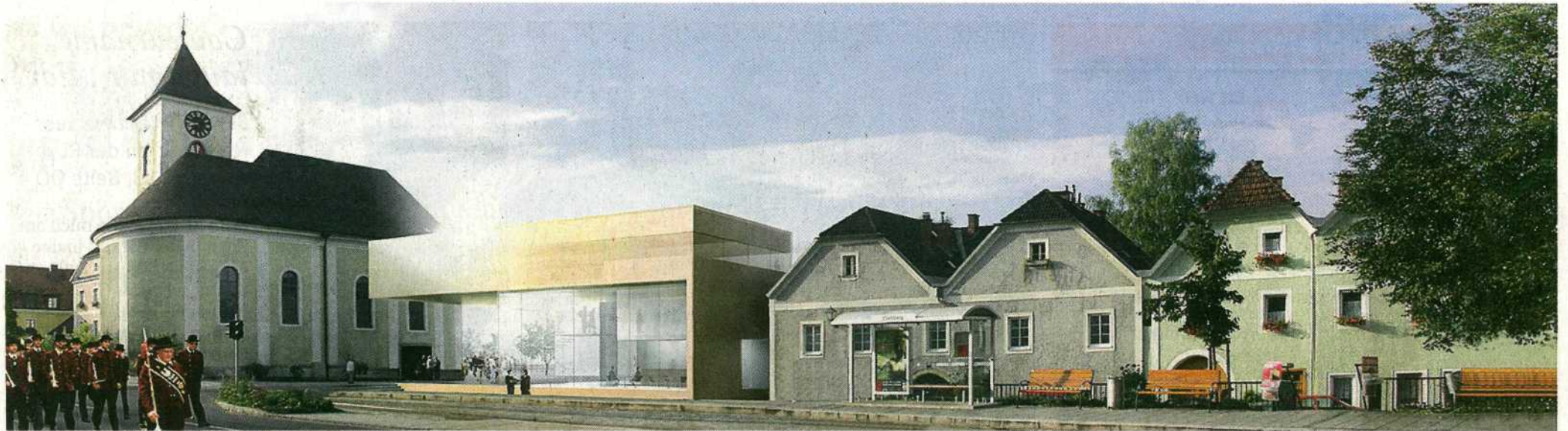
Der gläserne Neubau beim Pfarrzentrum Ebelsberg soll bis Mai 2009 fertig sein. Die Baukosten werden cirka 3,6 Millionen Euro betragen.