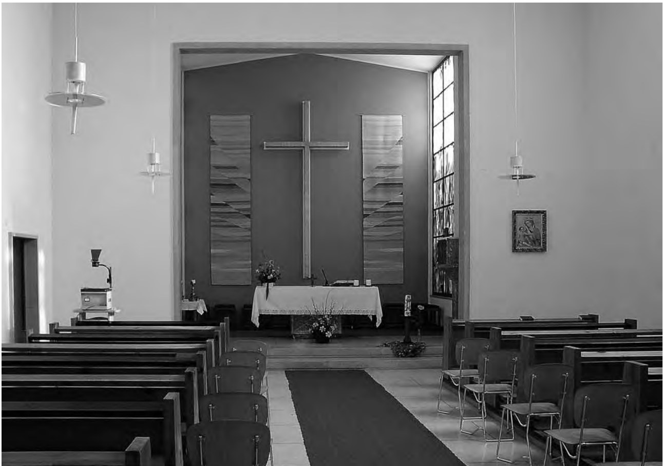
Innenraum der Filialkirche

Ein Ebelsberger Kleinod ist 50 Jahre alt geworden. Über eine erweiterte Nutzung sollte nachgedacht werden.