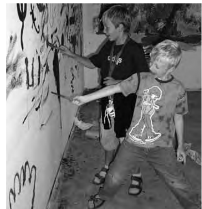
Kinderprogramm beim Abrissfest