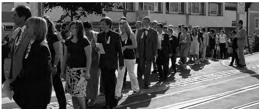
Einzug der Firmlinge, 2007