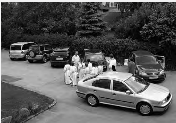
Fahrzeugsegnung am Christophorussonntag, 2007