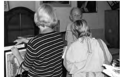
Flohmarkt mit Gegenständen aus dem alten Pfarrheim