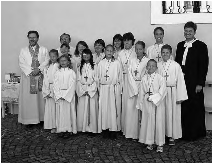
Ministrantengruppe mit Pfarrer, Kaplan und Ministrantenleiter

In unserer Pfarre verrichten 22 Kinder und Jugendliche den Ministrantendienst.