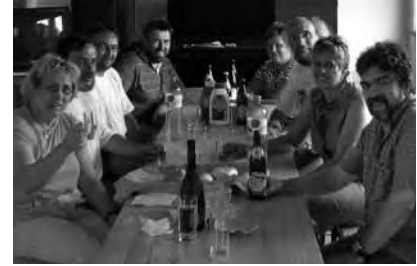
Ausräumaktion – wohlverdiente Jause