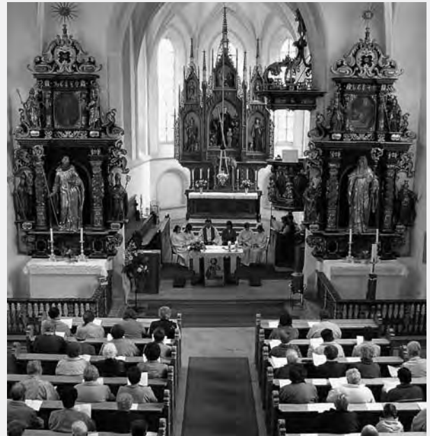
Frauenwallfahrt nach Heiligenleithen bei Pettenbach im Oktober 2007