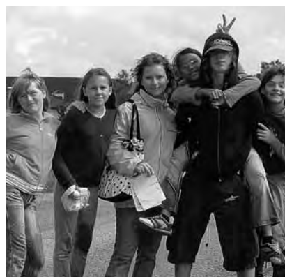
Jungscharlager in Lest, Juli 2007