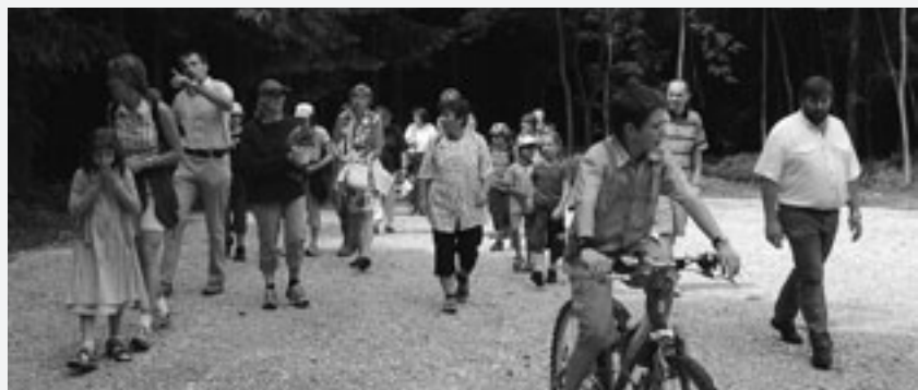
Ausflug des „Pfarrcafe“-Teams