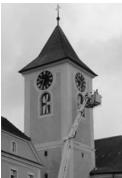
Segnung der Florianerwappen

Am 2. Mai wurden die vier Wappen feierlich geweiht. Nach der Segnung zog die Festge-