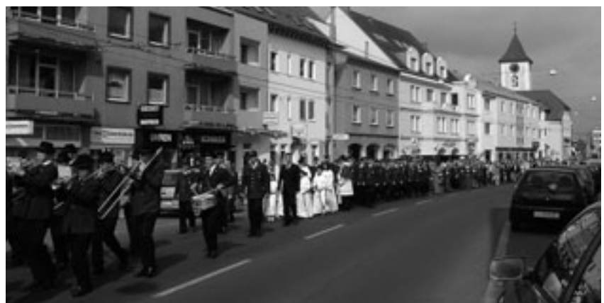
Festzug zum Feuerwehrdepot

meinde zum neuen Feuerwehrdepot, wo der Florianifestgottesdienst gefeiert wurde.