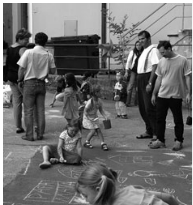
Spielfest vorm Kindergarten