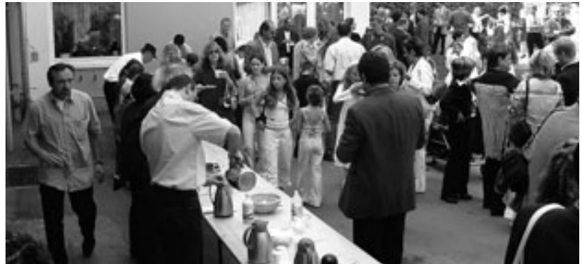
Die Agape nach der Erstkommunion wurde von der Katholischen Männerbewegung organisiert.

Seit Herbst 2002 gibt es in unserer Pfarre ein Erstkommunionsteam. Derzeit unterstützen unseren Herrn Pfarrer in dieser Arbeitsgruppe 10 Personen. Das EK-Team organisiert die Tischelterarbeit, bereitet Gottesdienste, die mit der Hinführung dieser Feier im Zusammenhang stehen, vor. Wie z.B. Vorstellungsmesse, Fußwaschung am Gründonnerstag, Versöhnungsfeier bzw. Beichtfest ... . Eine Hauptaufgabe ist die Vorbereitung des