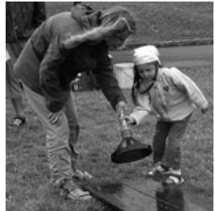
Spiele auf der evangelischen Pfarrwiese