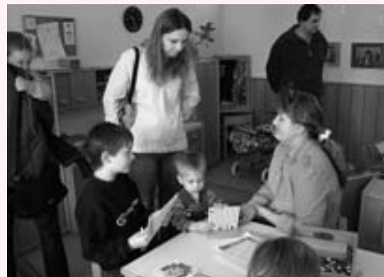
Tag der offenen Tür im Kindergarten 2005

Das Kindergartenteam und alle Mitwirkenden freuen sich auf euren Besuch.