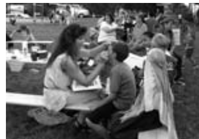
Fest beim Begegnungszentrum 2005

ein Sommerschlussfest auf der Spielwiese im Ennsfeld. Beginn: 14 Uhr. Es gibt Spiel und Spaß für Kinder und Jugendliche, Kuchen und Kaffee, Grillerei und Getränke für alle Altersgruppen.