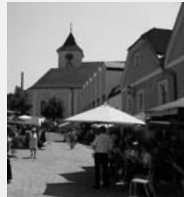
Johanniskirtag am Fadingerplatz