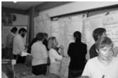
Klausur in Kaltenberg