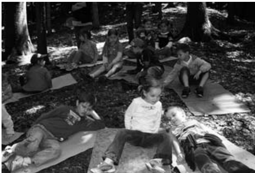
Wald und Au als Lebens-, Erfahrungs- und Spielraum

Vielleicht sind diese Zeilen auch für Sie, liebe Eltern, eine Anregung den Freizeit- und Erholungswert des Waldes bewusst zu nutzen.