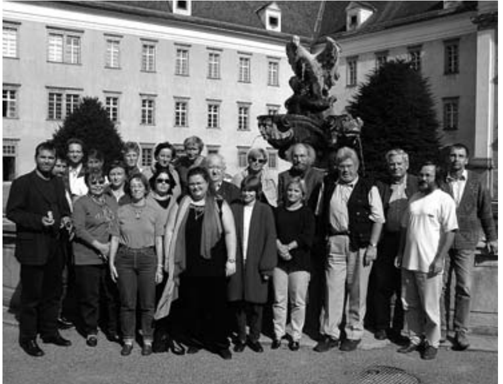
Klausur im Stift St. Florian