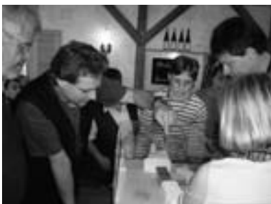
Klausur auf der Eidenberger Alm

Geeignete Personen für dauerhafte Dienste und Ämter in der Kirche werden gesucht – Diakon, BegräbnisleiterInnen, WortgottesdienstleiterInnen, JugendleiterInnen.