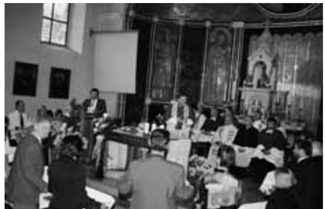
Pfarrgemeinderat übergibt Mauersteine