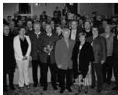
Verleihung des „Goldenen Krugs“

Sprecher der Ebelsberger-Pichlinger Vereine.