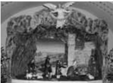
Krippe in der Pfarrkirche

In der Reformationszeit stellte die Ablehnung der Heiligenverehrung auch Nikolaus als Geschenkbringer in Frage. Luther sprach sich dafür aus, Christus als Gabenbringer an die Stelle eines Heiligen treten zu lassen. In protestantischen Ländern wurden das Aufstellen und Füllen von Schuhen am Nikolaustag und die traditionellen Nikolausumgänge verboten.