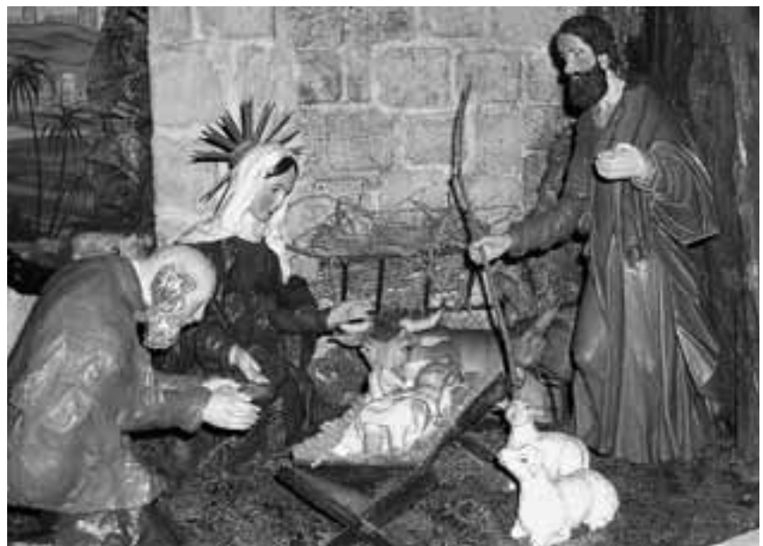
Krippe in der Pfarrkirche