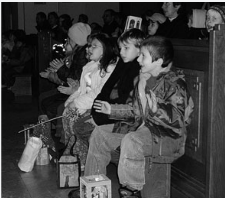
Unsere Volksschulen feierten das Martinsfest in der Pfarrkirche