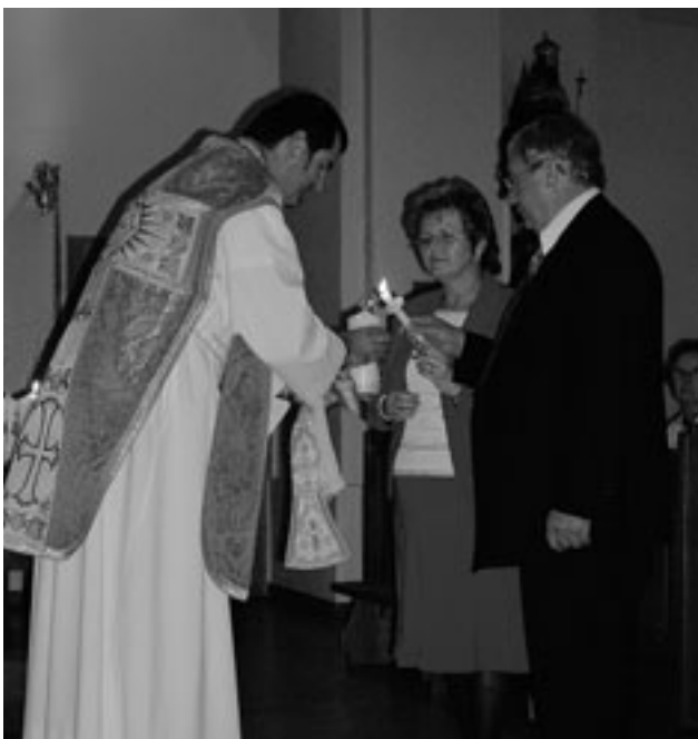
Silber - Jubelpaar

Gottes Segen für den gemeinsamen Lebensweg!