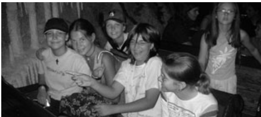
Jungschar Ausflug zur Grottenbahn