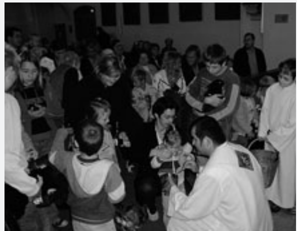
Tiersegnung in der Pfarrkirche