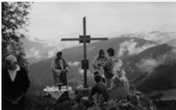
Bergmesse auf der Lindaumauer