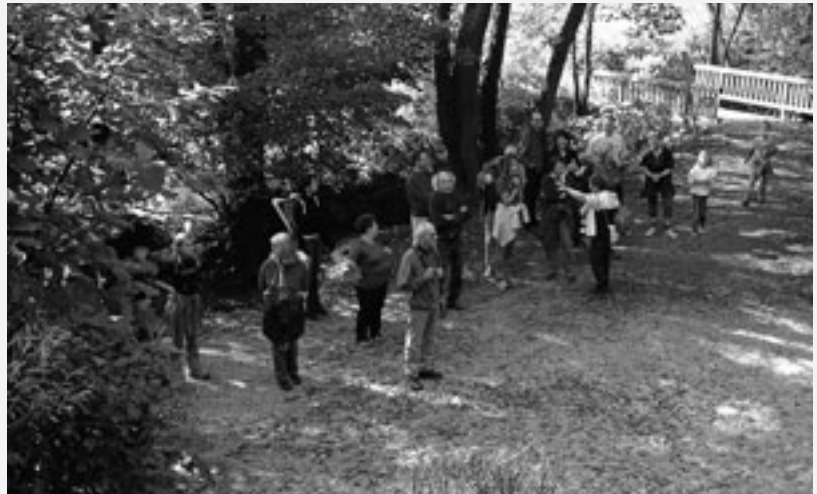
Unsere Herbstwanderung führte uns auf den Grünberg