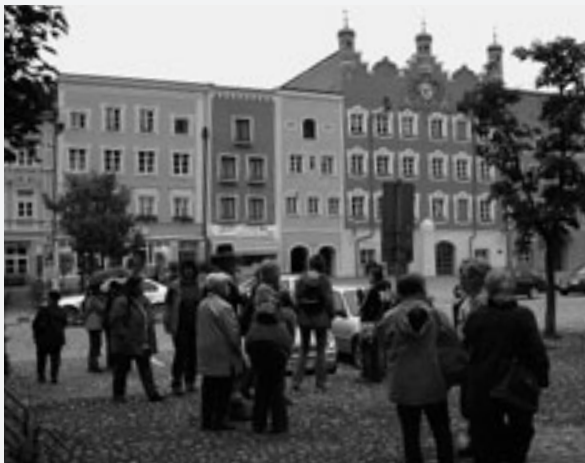
Nach der Wallfahrtsmesse besuchten wir Burghausen.